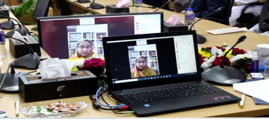
চিত্রঃ শিক্ষা উপকরণ বিতরণ অনলাইন উদ্বোধনী প্রোগ্রামে মাননীয় শিক্ষামন্ত্রী ডা. দীপু মনি এম.পি.