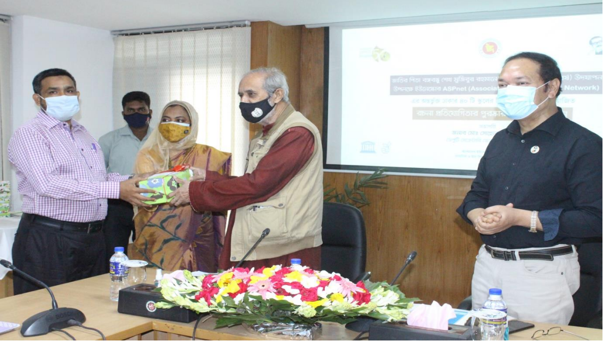
চিত্রঃ রচনা প্রতিযোগিতার পুরস্কার বিতরণ।