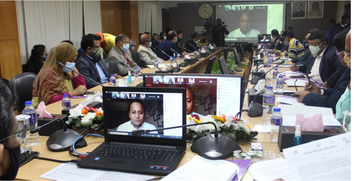
চিত্রঃ আন্তর্জাতিক শিক্ষা দিবস-২০২১ আলোচনা সভায় বিশেষ অতিথি হিসেবে ভার্চুয়াল মাধ্যমে উপস্থিত ছিলেন শিক্ষা মন্ত্রণালয়ের মাননীয় উপমন্ত্রী জনাব মহিবুল হাসান চৌধুরী এম.পি.