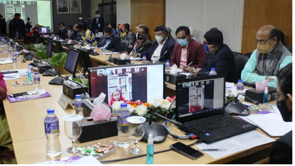
চিত্রঃ আন্তর্জাতিক শিক্ষা দিবস-২০২১ আলোচনা সভায় প্রধান অতিথি হিসেবে ভার্চুয়াল মাধ্যমে উপস্থিত ছিলেন শিক্ষা মন্ত্রণালয়ের মাননীয় মন্ত্রী ডা. দীপু মনি এম.পি.।