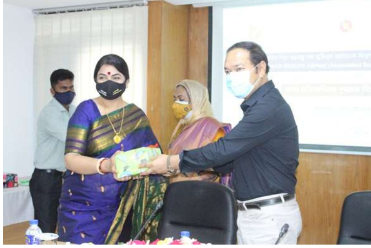
জাতির পিতা বঙ্গবন্ধু শেখ মুজিবুর রহমানের জন্মশতবর্ষ (মুজিববর্ষ) উদযাপন উপলক্ষে ইউনেস্কোর ASPnet (Associated School Project Network) এর অন্তর্ভুক্ত ঢাকার ৪০ টি স্কুলের শিক্ষার্থীদের নিয়ে রচনা প্রতিযোগিতার পুরস্কার বিতরণ