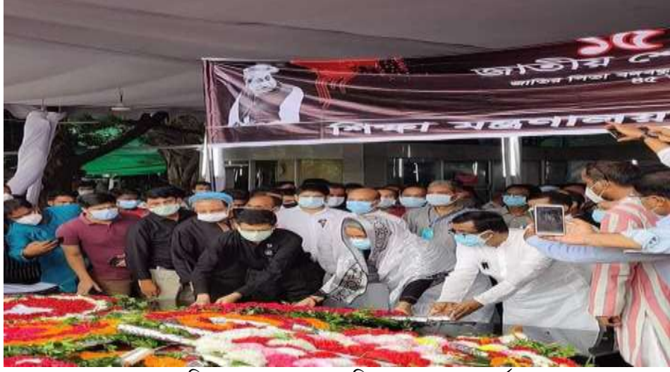
ধানমন্ডি ৩২ নম্বরে বঙ্গবন্ধুর স্মৃতিফলকে পুষ্পস্তবক অর্পণ