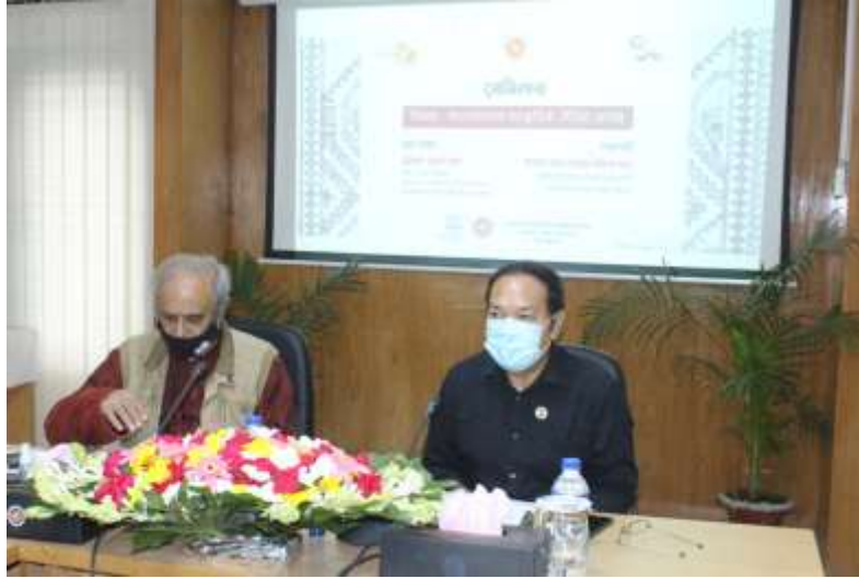
“বাংলাদেশের সাংস্কৃতিক ঐতিহ্য” শীর্ষক সেমিনার

বিভিন্ন অংশীজনের সমন্বয়ে মুক্তিযুদ্ধ, বঙ্গবন্ধু, শিক্ষা, বিজ্ঞান, আইসিটি, সংস্কৃতি বিষয়ক সিরিজ সেমিনার/ ওয়ার্কশপ/ আলোচনা সভার অংশ হিসেবে “বাংলাদেশের সাংস্কৃতিক ঐতিহ্য” শীর্ষক সেমিনার আয়োজন করা হয়। প্রতিভাশা কবি ও বাংলা একাডেমি এর নবনিযুক্ত মহাপরিচালক জনাব মুহম্মদ নূরুল হুদা এতে মূল প্রবন্ধ উপস্থাপন করেন।