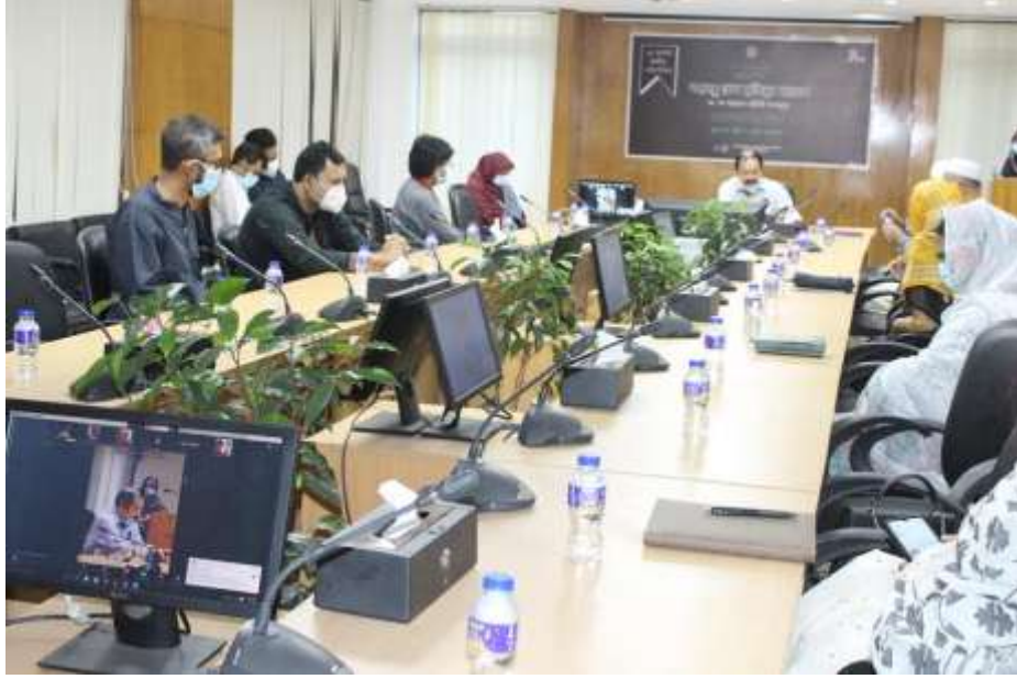
বিএনসিইউ'র কনফারেন্স কক্ষে বঙ্গবন্ধু শেখ মুজিবের অবদান ও আত্মত্যাগ এর বীরগাঁথা বিষয়ক আলোচনাসভা

বঙ্গবন্ধুর স্মৃতির প্রতিশ্রদ্ধা নিবেদনপূর্বক তাঁর বাণী সম্বলিত বেশ কয়েকটি ছবি ফ্রেমে বাঁধাই করে বিএনসিইউ অফিস প্রাঙ্গণের বিভিন্ন জায়গায় সন্নিবেশ করা হয়।